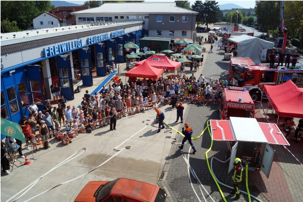
Abbildung 1: Jugendfeuerwehr und Besucher am Feuerwehrfest-Sonntag während der Schauübung mit neuen PKW-Anhänger (rechts)